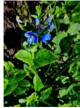
エゾヒメクワガタ