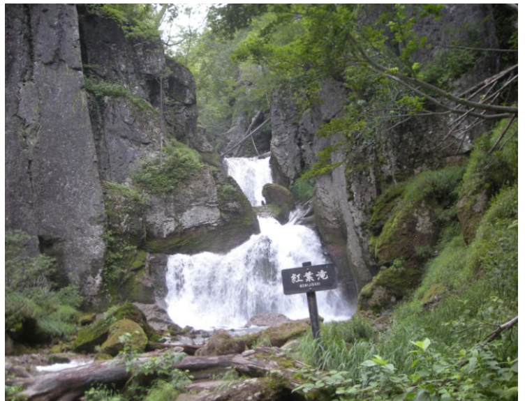
紅葉滝：雨の影響で水量が多くなっていました