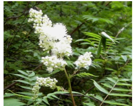
ホザキナナカマド