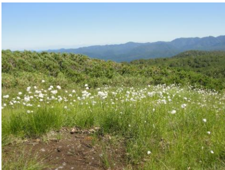
④第二花畑のワタスゲ

①第一花畑より緑岳方面。チングルマの草紅葉が目立つようになってきました。②第一花畑のウラジロナナカマドがうっすら色付いてきました。③第二花畑より緑岳方面。花のシーズンは終了し、あとは紅葉を待つだけとなりました。