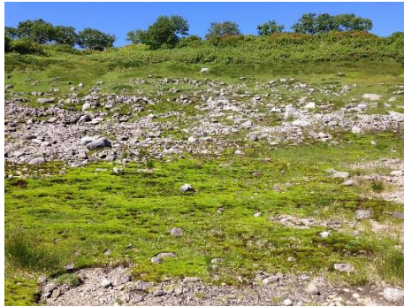
②第一花畑のチングルマ