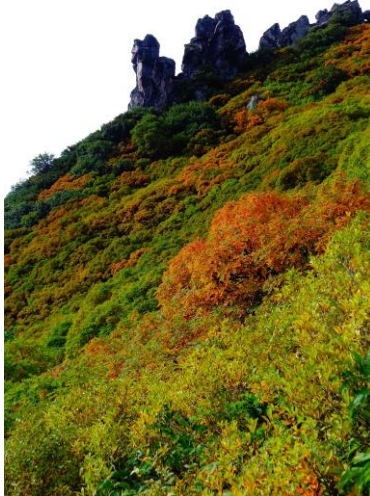
③黒岳九合目マネキ岩