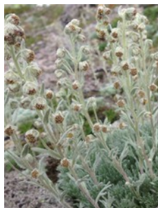
エゾハハコヨモギ