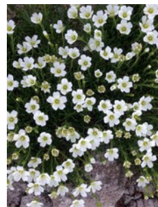
エゾタカネツメクサ