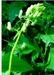
エゾノレイジンソウ