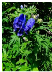
ダイゼツトリカブト