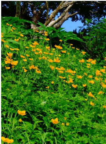
①黒岳七～八合目周辺

【開花状況】【七合目～雲ノ平】 マルバシモツケ・ミヤマアキノキリンソウ・エゾノレイジンソウ・ナガバキタアザミ・ヤマハハコ・ダイゼツトリカブト・ハイオトギリ・エゾウサギギク・ウコンウツギ・モミジカラマツ・ヤマブキショウマ・ハクサンボウフウ・ハクセンナズナ・エゾヒメクワガタ・タカネスイバ・ミヤマキンポウゲ・チシマノキンバイソウ・ハクサンチドリ・キバナノコマノツメ・カラマツソウ・チシマヒョウタンボク・トカチフウロ・エゾイワツメクサ・イワギキョウ・ヒメイワタデ・キバナシャクナゲ・メアカンキンバイ・エゾコザクラ・コマクサ・イワブクロ↓・ミネズオウ・エゾツガザクラ・チングルマ・イワヒゲ・ミヤマリンドウ・エゾハハコヨモギ等