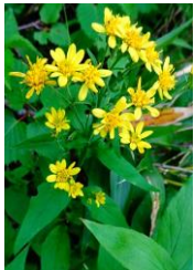
ミヤマアキノキリンソウ