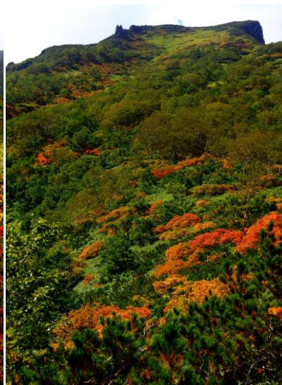
⑧七合目登山事務所周辺

⑤さらに色濃くなり範囲も広がってきた。先に見頃となっていたものはやや黒ずんできたが、まだ緑葉もあるため見頃時期は続くと思われる。⑥⑦チングルマ・クロマメノキ・ミネヤナギ等の草紅葉、一部で見頃のものも出始めた。⑧新たに出来た散策コース「黒岳カムの森のみち」片道約 20 分で黒岳が眼前に。赤石川、水量は落ち着いていましたが前日・当日雨の場合は要注意です。装備を万全に。