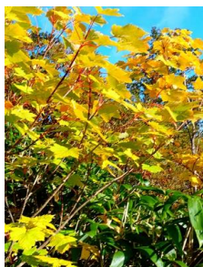
八合目・ミネカエデ