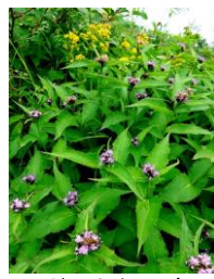
ナガバキタアザミ

*ヒグマの目撃情報が多くなっています。また、登山道上では「痕跡」も見つかっています。鳴り物は必ず持参するようお願い致します。