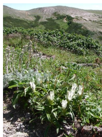
⑧白雲岳避難小屋前

⑤第4雪渓周辺では、雪解けが進んだところからエゾウサギギク、ミヤマリンドウ、アオノツガザクラなどが咲いてきている。⑥赤岳山頂周辺では、ほぼ花の時期は過ぎ、場所によってはヒメイワタデ、ウラシマツツジなどが赤く色づいてきている。⑦白雲岳分岐から白雲岳避難小屋にかけては、小規模ではあるがチングルマとエゾコザクラの群落が見られる。⑧白雲岳避難小屋前では、クモイリンドウが咲き始めているが、例年よりも少し開花時期が遅く花数も少ない。小屋前の水場周辺では、ダイセツトリカブト、トカチフウロ、チシマノキンバイソウ、エゾウサギギクなどが咲いている。