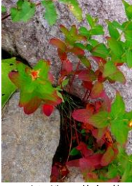
ハイオトギリ 草紅葉

【開花】【七～雲ノ平】モミジカラマツ・チシマヒョウタンボク・ハクサンボウフウ・ミヤマアキノキリンソウ・チシマノキンバイソウ↓・ヤマハハコ・コモチミミコウモリ・ヤマブキシヨウマ・タカネスイバ・エゾノレイジンソウ・ハイオトギリ↓・タカネトウウチソウ↓・ウメバチソウ・オニシモツケ・エゾウサギギク・アザミ類・シラネニンジン・ダイセツトリカブト・ミヤマセンキュウ・マルバシモツケ↓・コマクサ・イワブクロ↓・エゾツガザクラ・エゾコザクラ・チングルマ・イワギキョウ・サマニヨモギ・ミヤマキンバイ・ミヤマリンドウ等 ハイオトギリやマルバシモツケ等の草紅葉が出始めた。