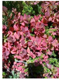
ヒメクロマメノキ