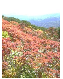
ウラジロナナカマド