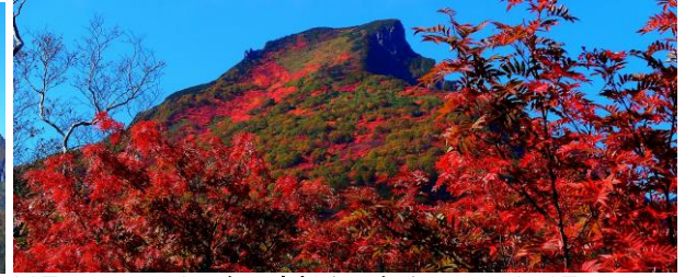
黒岳五合目展望台から 左端より黒岳・桂月岳・凌雲岳・上川岳17日 黒岳五合目高松台展望台から黒岳 17日

【紅葉情報】さらに色付きが増し、黒岳北東斜面から北鎮岳分岐下、北海沢方面は紅葉の最盛期を迎えています。大雪山系全体的に見頃の状態となりました。（高原温泉は約5割）今年の紅葉は、赤が深く濃い色が出ており特に黒岳九合目周辺のウラジロナナカマドは見事な色付きとなっています。が、台風18号の影響が心配されるようです・・・