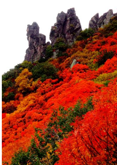
②黒岳九合目マネキ岩