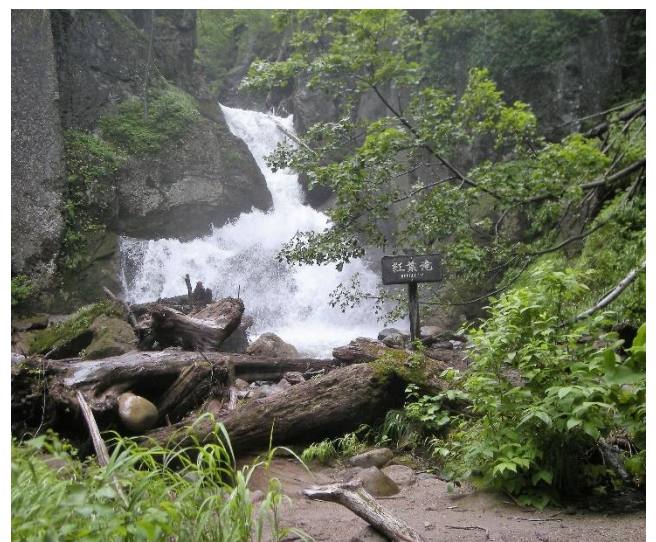
紅葉滝：水量が多く近寄れません