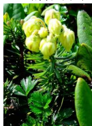
アオノツガザクラ