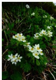
エゾノハクサンイチゲ