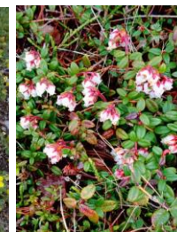
コメバツガザクラ

【開花情報】【八合目～石室】 ショウジョウバカマ・エゾイワハタザオ・ジンヨウキスミレ・エゾイチゲ・キバナノコマンツメ・ミヤマキンボウゲ・エゾノハクサンイチゲ・メアカンキンバイ・イワウメ・ミヤマキンバイ・キバナシヤクナゲ・ミネズオウ・ウラシマツツジ・コメバツガザクラ *シーズン最初に咲く「エゾイワハタザオ」、今年は群落が多く見受けられ、シーズンインに向けて幸先の良い花付である。「チシマノキンバイソウ」「カラマツソウ」蕾。