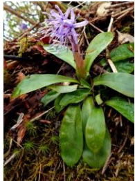
ショウジョウバカマ