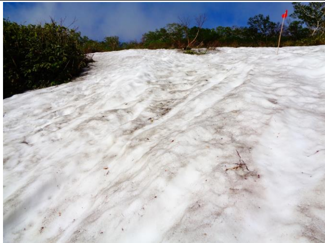
②黒岳七合目周辺(写真は下から撮影)