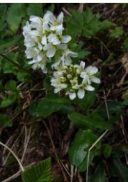
エゾイワハタザオ