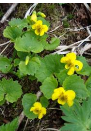
ジンヨウキスミレ