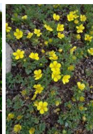
メアカンキンバイ