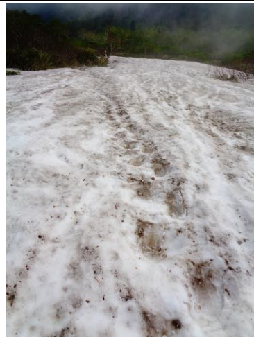
③黒岳八合目周辺(写真は上から撮影)

①②③登り初めから7m・3m・7m・七合標柱・41m・14m・八合標柱・32m・その後九合標柱まで消雪。断続的に登山道が露出しているものの、ほぼ雪の上を歩く。雪どけとともに「川状態」「ドロドロ登山道」「踏み抜き」「滑落危険」「道迷い危険」と様々な状態。雪渓は、ここ数日気温が上がらず硬い部分が多い。本日はやや気温上昇の為、上面は柔らかいがその下は氷。場所によっては「ステップ」もきかない硬い雪。特に下りでの滑落の危険が大。スニーカー程度や軽登山靴では登頂は難しいです。(登山靴でも恐怖を感じたとの談) 最低でも「軽アイゼン」「ストック」の携行を強くお勧めします。*先日は九合目周辺で滑落事故も発生しヘリで搬送されています。