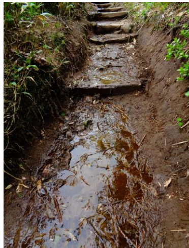
③黒岳七～八合目周辺