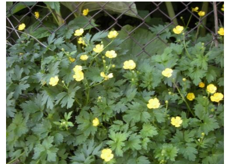
紅葉谷へ向かう道路の法面: エゾスカシユリ群落とオオハナウド・カノコソウ・ハイキンポウゲ