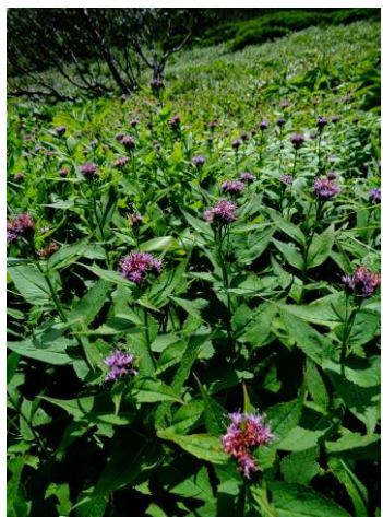
①黒岳八合目～頂上周辺

【紅葉情報】 七八九合目周辺のウラジロナナカマドがやや色が抜けてきた。山頂以降は緑葉が主体。2015年度に気象の影響で「下から上に」逆紅葉していった年があったが、現段階では判断ができない。黒岳のみで見ると、昨年と似たような進み具合であるが、今後の気象で変わる可能性有。ハイオトギリ・チングルマ等の草紅葉も色が付き始めてきているものもあり。 【開花情報】 コモチミコウモリ・ハクセンナズナ・ヤマハハコ・カラマツソウ・エゾコザクラ・ハイオトギリ・トカチフウロ・ダイセツトリカブト・アザミ類・イワギキョウ・イワブクロ・ミヤマキンバイ・イワヒゲ・コマクサ・ヨツバシオガマ・エゾツガザクラ・アオノツガザクラ・チングルマ・ミヤマリンドウ等