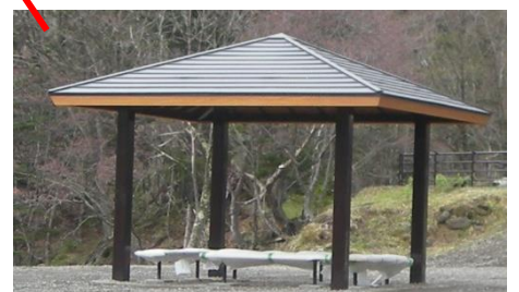
あずまや (四阿) ↑