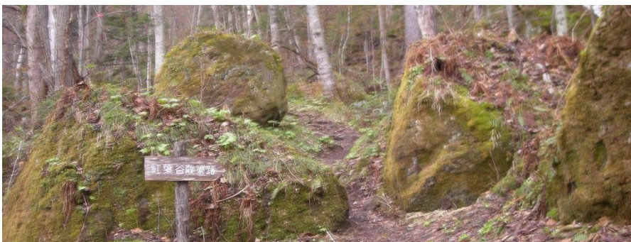
雪解けを終えたばかりの散策路