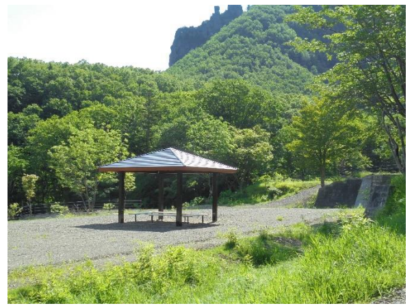
入り口の看板とあずまや (四阿)