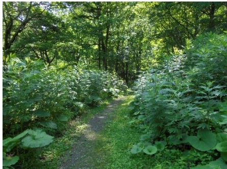
背が高くなってきたハンゴンソウ