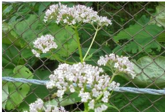
カノコソウ・エゾスカシユリ (この二つは道路の法面)