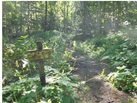
クマゲラ広場のレイジンソウはほぼ終了