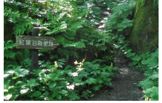
この看板から登りが始まります