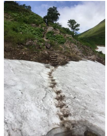
④エイコの沢ガレ場

残雪状況: シバ山尾根付近に20m, 8m, 10mと3ヶ所、エイコの沢ガレ場下に5mほどの残雪あり。