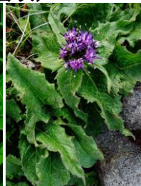
ウスユキトウヒレン