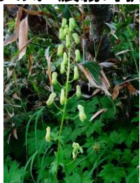
エゾノレイジンソウ