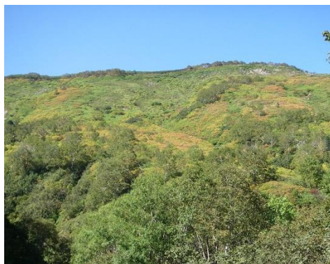
① 林道からみた第1花園