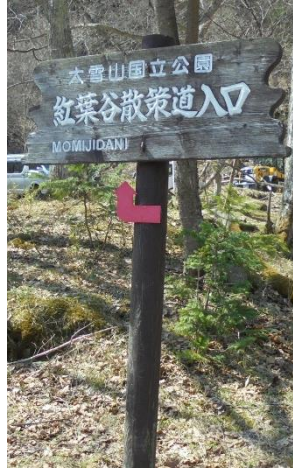
入り口看板付近の様子