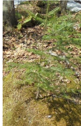
岩の上のトドマツ