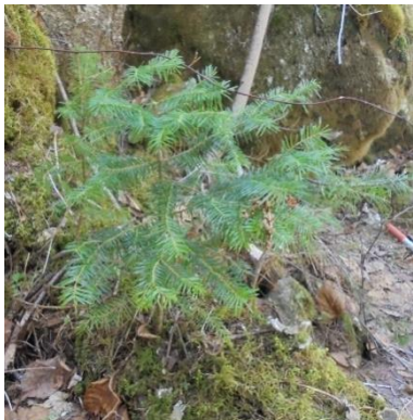
トドマツの倒木更新 他に根株更新もあります

アカエゾマツ・エゾマツ・イチイ・イタヤカエデ・ミズナラ・シナノキ・ドロノキ・シウリザクラなど