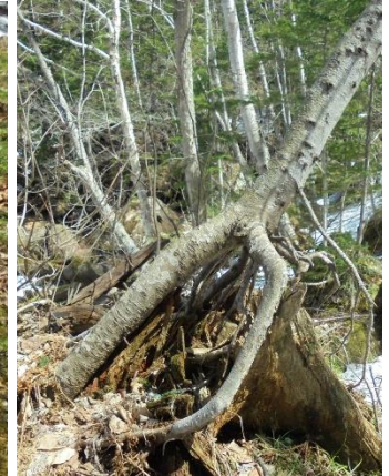
根上りしたトドマツ

アカエゾマツ・エゾマツ・イチイ・イタヤカエデ・ミズナラ・シナノキ・ドロノキ・シウリザクラなど