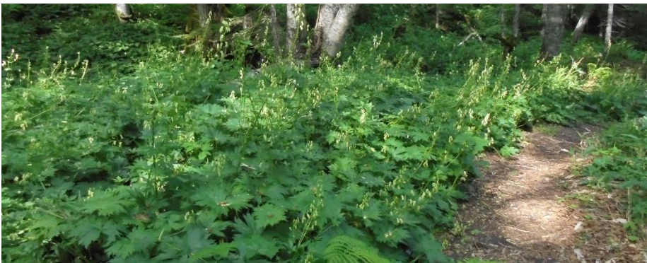
クマゲラ広場のエゾノレイジンソウ