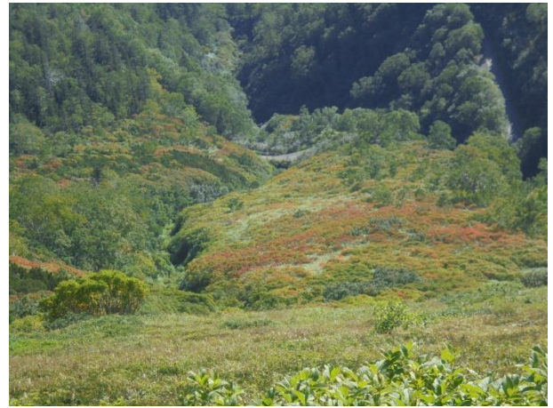
③第一花園下部俯瞰

赤岳登山道でも紅葉が順調に進んでいます。写真では判りづらいのですが、第一花園の斜面では、見た目に「紅葉しているな」と思えるくらい色づきが進みました①③。