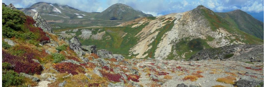
赤岳山頂より北鎮岳～黒岳方面