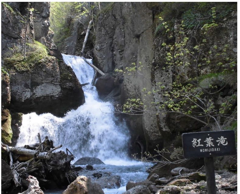
清涼感いっぱいの紅葉滝