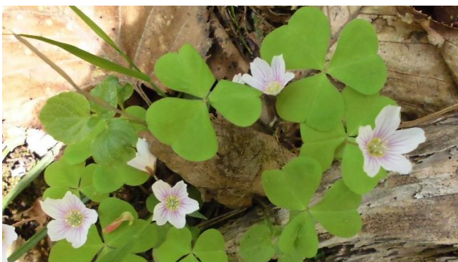
コミヤマカタバミ