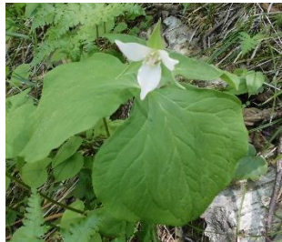
ミヤマエンレイソウ