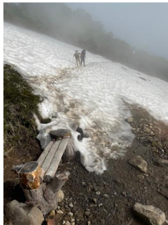
②第一花園看板付近