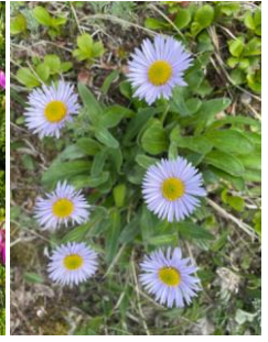
ミヤマアズマギク