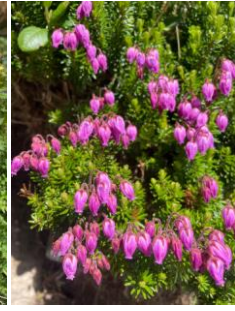
エゾノツガザクラ