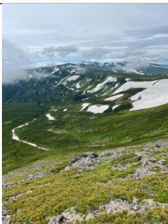
⑦南沢上部から高根が原東斜面