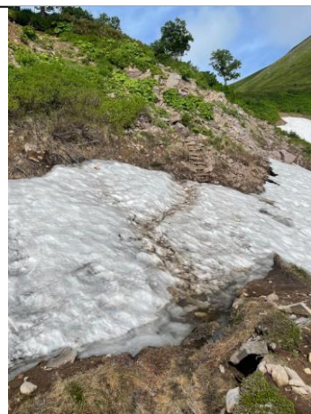
⑥エイコの沢ガレ場