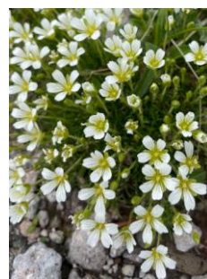
エゾタカネツメクサ