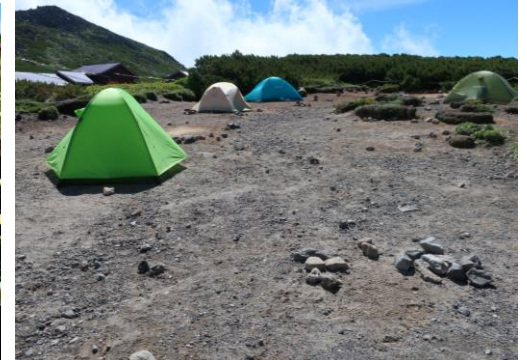
⑥黒岳石室テント場

北嶺岳の白鳥・千鳥の雪渓です。快晴のため、北嶺岳分岐下の雪渓のマーカ―もはっきり見えました④。雲ノ平周辺ではチングルマがきれいに咲いていました。先週まで、咲いてはいるもののまばらな状態だったのですが、ようやく群落状態に近づきました。チングルマは石室周辺でもきれいに咲いています⑤。黒岳石室のテント場は、平日の利用は余裕がありそうです。(先週末 7/15 は8～9割ほど埋まっている状況でした。) ⑥。