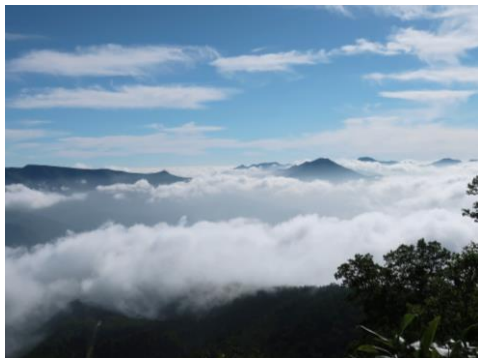
①黒岳北東斜面から見た雲海

【開花情報】【九合目～山頂】 トカチフワロ・ミヤマキンボウゲ・チシマノキンバイソウ・カラマツソウ・ハクサンチドリ・ウコンウツギ○ チシマヒョウタンボク・ハクサンボウフウ・マルバシモツケ↑ エゾウサギギク・ハイオトギリ・ミヤマアキノキリンソウ・タカネトウチソウ・ヤマブキシヨウマ始 【山頂～石室】 イワヒゲ・コマクサ・メアカンキンバイ・ミヤマキンバイ・エゾイワツメクサ・イワブクロ・チングルマ・エゾコザクラ○ エゾツツジ・エゾノマルバシモツケ・イワギキョウ・ゴゼンタチバナ・チシマキンレイカ・ヨツバシオガマ↑ チシマツガザクラ始