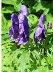
ダイセツトリカブト