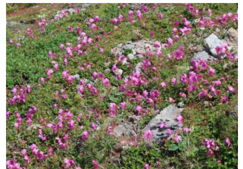
③黒岳山頂～ポン黒岳周辺

リフトに乗車した時には濃霧で辺りは真っ白だったのですが、降り場に近づくにつれて霧が晴れ、雲一つない青空に！そして、振り返ると雄大な雲海が目の前に広がっていました！この日は風も弱く、8時前まで雲海を楽しむことができました①。黒岳の北東斜面ではまだまだチシマノキンバイソウがきれいに咲き誇っています。特に、山頂下では群落を形成しており、見応えがあります②。黒岳山頂周辺ではエゾツツジが小群落を形成していますが、山頂付近ではピークを過ぎてしまったものも多く見られました。しかし、ガレ場の辺りでは頂上付近よりも大きなまとまりで咲いており、「赤い絨毯」となっていました。コマクサは萎れかけのものも見られましたが、変わらずきれいに咲いているものが多かったです。今、イワブクロが見頃を迎えています③。