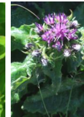
ウスユキトウヒレン