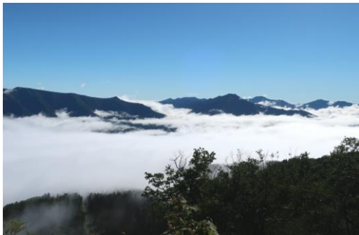
①黒岳北東斜面から見た雲海

【開花情報】【九合目～山頂】チシマノキンバイソウ・トカチフフロ・マルバシモツケ○ エゾウサギギク・ハイオトギリ・ミヤマアキノキリンソウ・タカネトウチソウ・ヤマブキシヨウマ・オニシモツケ↑ ハクサンボウフウ・ハクサンチドリ・エゾヒメクワガタ・チシマヒョウタンボク・ミヤマキンボウゲ↓ ダイセツトリカブト・チシマアザミ・ナガバキタアザミ・ウメバチソウ・ミヤマアカバナ始【山頂～石室】イワヒゲ・コマクサ・エゾツツジ・メアカンキンバイ・ミヤマキンバイ・エゾイワツメクサ・イワブクロ・チングルマ・エゾコザクラ・イワヒゲ・イワギキョウ・ヨツバシオガマ○ エゾノマルバシモツケ・チシマキンレイカ・ミヤマリンドウ・エゾノツガザクラ・ハクサンボウフウ↑