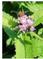
ナガバキタアザミ