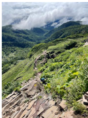
③エイコの沢ガレ場