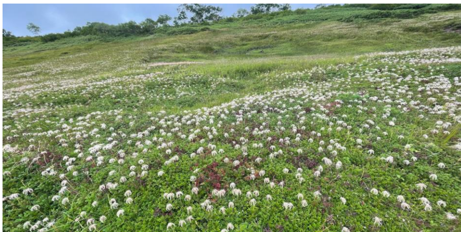
チングルマの綿毛(第二花畑)