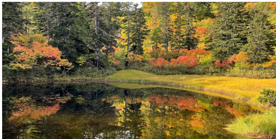
色づきが進む滝見沼