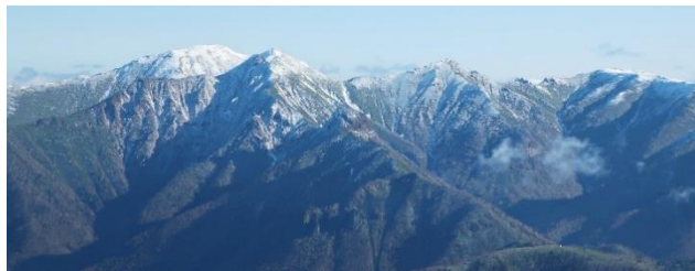
②九合目下から見た北大雪の山々

10/5に初雪と初冠雪が観測された黒岳。五合目周辺の散策路に積雪はなく、草むらに雪が残る程度でした①。本日(10/9)は一日を通して好天に恵まれ、ヒグマの足跡も見かけませんでしたが、ヒグマに遭遇する可能性はまだあります。冬山装備&ヒグマ対策をお忘れなく!!