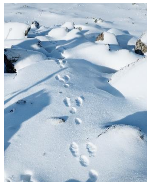
⑩エゾユキウサギの足跡

雲ノ平、赤石川周辺の登山道は深いところで積雪が 30~40 cmありました⑩⑫。赤石川は問題なく渡渉できました⑬。