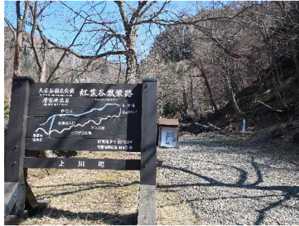
入口看板付近の様子