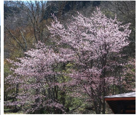
東屋近くのエゾヤマザクラ