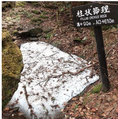
散策路上の大きい残雪2ヶ所