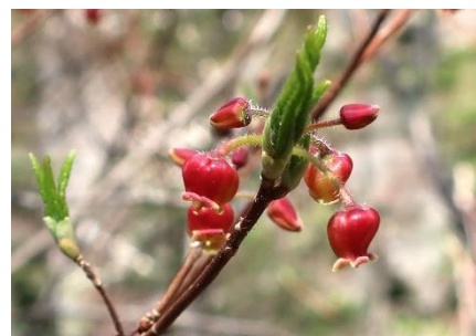
コヨウラクツツジ