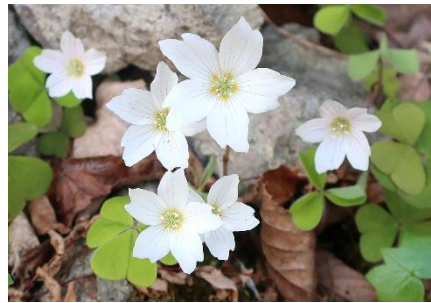
コミヤマカタバミ