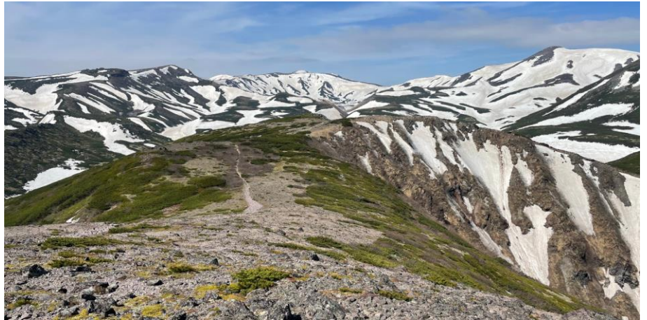
黒岳山頂からの眺望