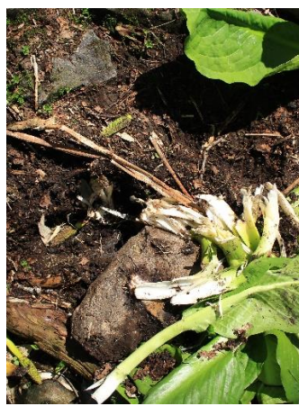
③ヒグマが水芭蕉を採食した痕跡