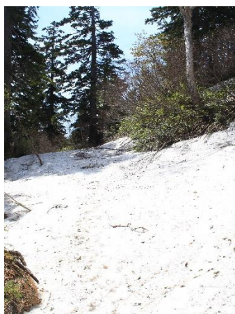
①コースはまた雪の下