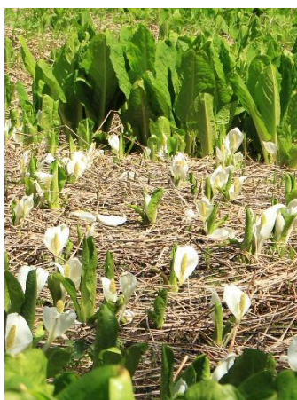
②花が咲き頃の水芭蕉