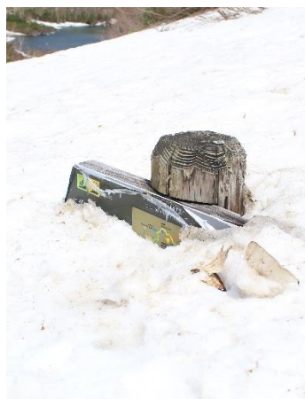
⑥三笠新道分岐標識