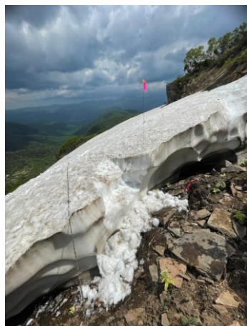
⑤エイコの沢ガレ場

稜線では、ミネズオウ・ミヤマキンバイ・キバナシャクナゲ・エゾオヤマノエンドウが咲き始めており、とくにミネズオウは見頃となっている。ホソバウルップソウは一部で咲き始めているが、ほとんどが蕾状態。