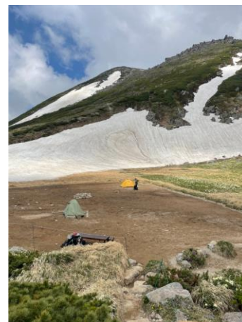
⑦白雲小屋テント場