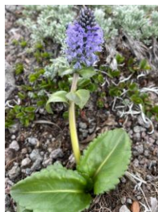
ホソバウルップソウ