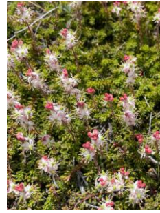
チシマツガザクラ