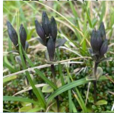
ヨコヤマリンドウ