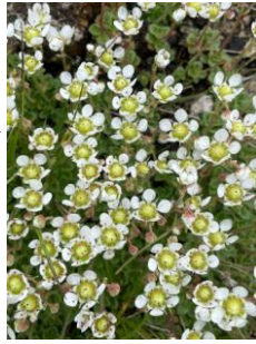
チシマクモマグサ