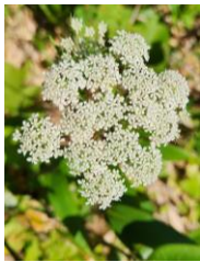
ミヤマセンキュウ