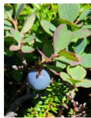
ヒメクロマメノキの実