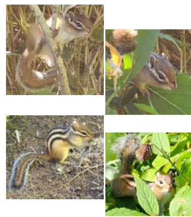
④黒岳登山道で出会ったシマリス

①ここ数日、八月下旬とは思えない暑さが続いています。黒岳には着実に秋がやってきています。八合目の登山道沿いではウラジロナナカマドがうっすらと色づいてきました。②黒岳九合目のマネキ岩周辺でもウラジロナナカマドの色が変わってきています。③黒岳山頂からガレ場に向かう登山道沿いではまだ色づき始めのものが多いですが、ウラシマツツジの紅葉が全体的に広がってきています。④秋になり、採食に忙しいエゾシマリス。この日は行きも帰りも黒岳の登山道上でエゾシマリスに何度も会いました。※この日も軽装、軽装備の方とたくさんすれ違いました。どんなに天気が良く、暑い日であっても、山の天気はいつ急変するかわかりません。山頂に上がると風も強いです。必ず防寒着と雨具はご用意ください。