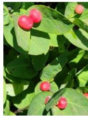
チシマヒョウタンボクの実