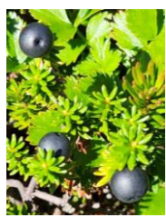
ガンコウランの実

【開花状況】【七合目～九合目】ミヤマセンキュウ○・ダイセツトリカブト・ヤマハハコ・ウメバチソウ・ミヤマアキノキリンソウ・ナガバキタアザミ・ミヤマアカバナ・ハイオトギリ等 【山頂～ガレ場】イワギキョウ○・エゾイワツメクサ等 【石室周辺】チングルマ(綿毛)・ミヤマアキノキリンソウ等 【雲ノ平方面】チングルマ(綿毛)・エゾオヤマリンドウ・ワタスゲ・ミヤマアキノキリンソウ等 【赤石川方面】チングルマ(綿毛)・ミヤマアキノキリンソウ○・ミヤマリンドウ○・ワタスゲ等