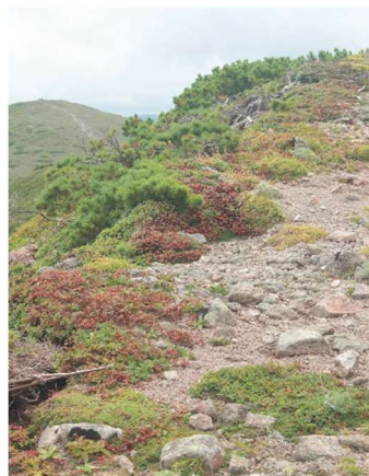
⑥ 板垣新道分岐付近