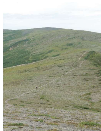
⑦ 緑岳山頂から小泉方面