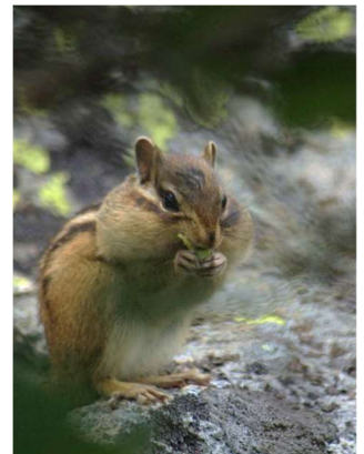
ハイマツの実を食べる シマリス