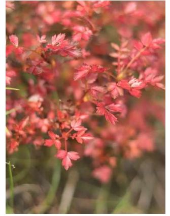
③ チングルマの紅葉

高原温泉へ行く林道沿いの色がちょっと付いてきた①。樹林帯を過ぎて、第一花畑から山頂方面を眺めると、ナナカマドがオレンジの帯のように色付いている②。チングルマは全体的に色が変わり始めているが、鮮やかな赤と枯れかけのような茶色の葉っぱが両方あった③。第二花畑辺りでキタキツネと出会ったが、体格は小さめ、警戒心が若干弱いので、若者と思われる④。