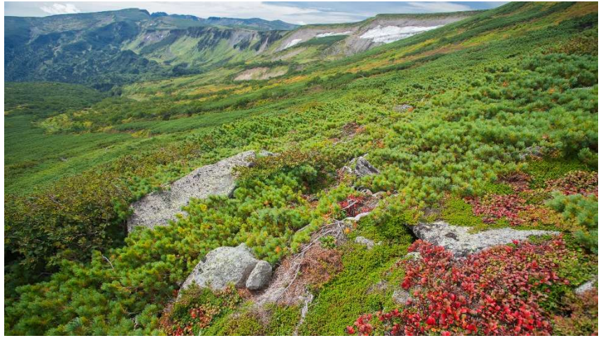
南沢上部から高根ヶ原眺め