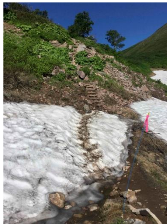
②エイコの沢ガレ場