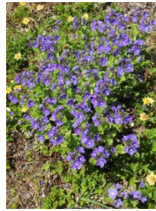
エゾヒメクワガタ