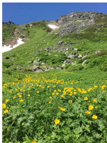
⑥白雲小屋水場付近