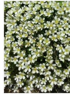
エゾタカネツメクサ